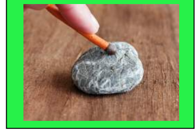
పటం - 10